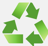
PRÉVENIR LES POLLUTIONS