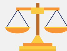
RESPECT DES LOIS DU SECTEUR

Pour répondre à ces fondamentaux, nous avons refondu notre Système de Management pour qu'il s'articule essentiellement autour des processus et pour qu'il fournisse aux différents pilotes tous les outils nécessaires.