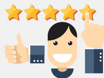
SATISFAIRE NOS CLIENTS